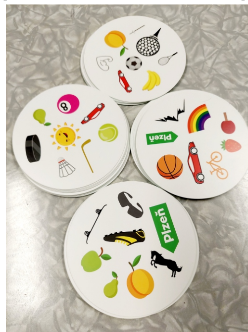
Foto: účastníci deskovek pořádaných Klubem a Klubíkem Zastávka

Krásné prožití svátečních dní a šťastný nový rok 2026!