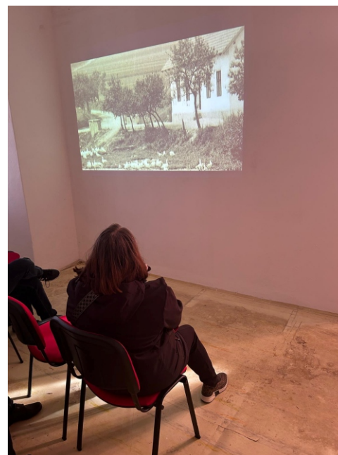
Foto: prostory v prvním patře zámku