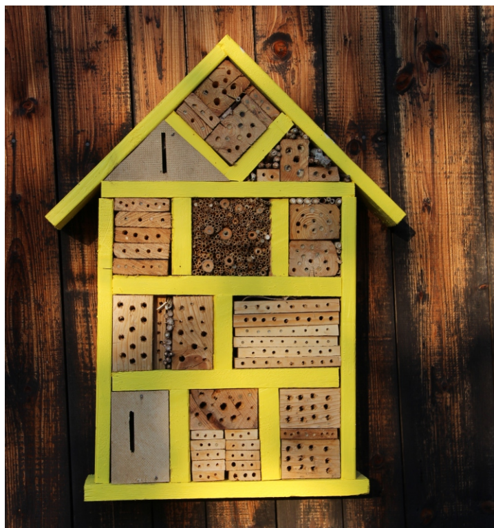
Foto: jedno z možných provedení hmyzího domku

Oč jde? Jedná se o člověkem vytvořenou skrýš z přírodnin, kterou si za dočasné nebo dlouhodobé obydlí vybírají zástupci hmyzí říše. Častým návštěvníkem jsou brouci, škvoři, motýli a další převážně z řad samotářského hmyzu. Kromě hmyzu, který žije ve společenstvích (jako jsou mravenci, včely, vosy a podobně) jsou totiž v našem okolí přítomni i zástupci samotářského hmyzu. Tyto druhy využívají pro kladení vajíček, vývoj larev a líhnutí různorodý materiál, který z našich dvorů a zahrad poslední dobou, vlivem změn zahradničení, mizí. Uvádí se, že 95 % druhů včel žije převážně samotářským způsobem života. Jen v České republice je to na 600 druhů včel, patřících do 6 čeledí. Většina včel samotářek žije pouze jeden rok, od podzimu v komůrce jako vajíčko, larva a kukla, od jara pak volně jako dospělá včelka. Na jaře se sameček spáří se samičkou, oplodněná samička poté buduje komůrky, do kterých pak naklade vajíčka a připraví jim zásobu potravy. Většina druhů má jen takovýto jednorokový cyklus,