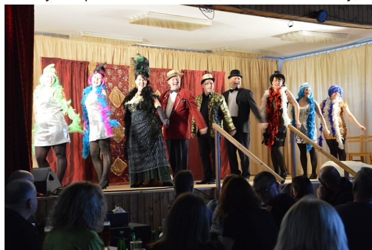
Foto: vlevo: část sboru dobrovolných hasičů, vpravo: vystoupení divadla PLUTO (archiv Václava Dlouhá)