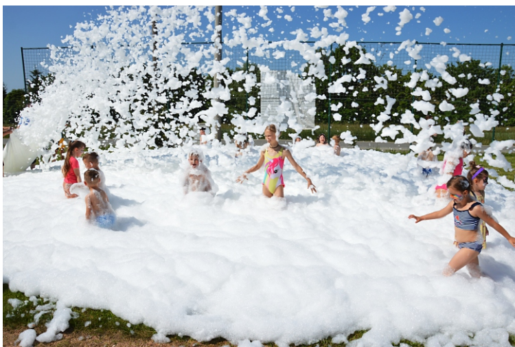
Foto: dovádění dětí v pěně na dětském dni v Bušovicích

Hned další sobotu 31.5. 2025 jsme uspořádali malé oslavy 115. výročí založení SDH, kde jsme si na slavnostní valné hromadě připomněli vznik a historii našeho sboru. O tom jste si přečetli již v minulém čísle Zpravodaje. A ocenili medailemi a čestnými uznáními různých stupňů aktivní hasiče.