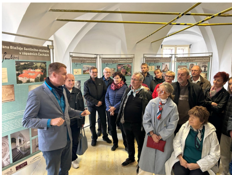
Foto: momentka z přednášky o díle J.B. Santiniho-Aichela (archiv Tereza Šlehoferová)