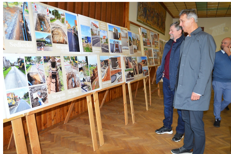
Foto: vlevo: slavnostní přestřižení pásky, vpravo: výstava na sále kulturního zařízení (archiv Václava Dlouhá)