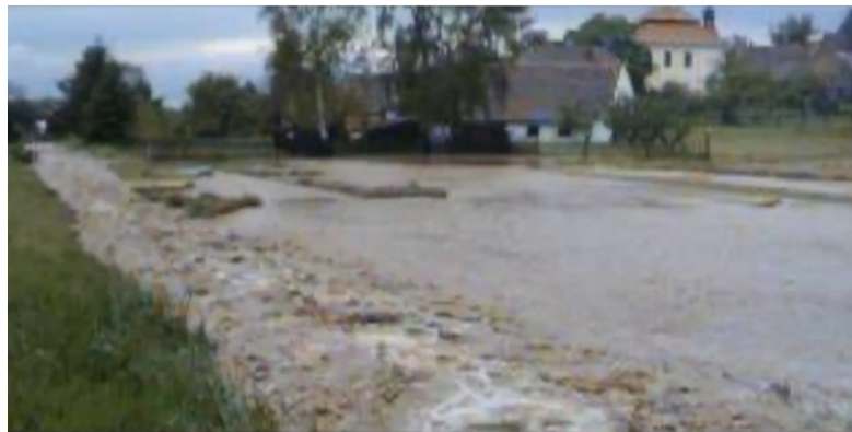
Foto: povodeň 2005 v Bušovcích a odkaz na kanál s videem https://www.youtube.com/watch?v=DYSDIYRUaI