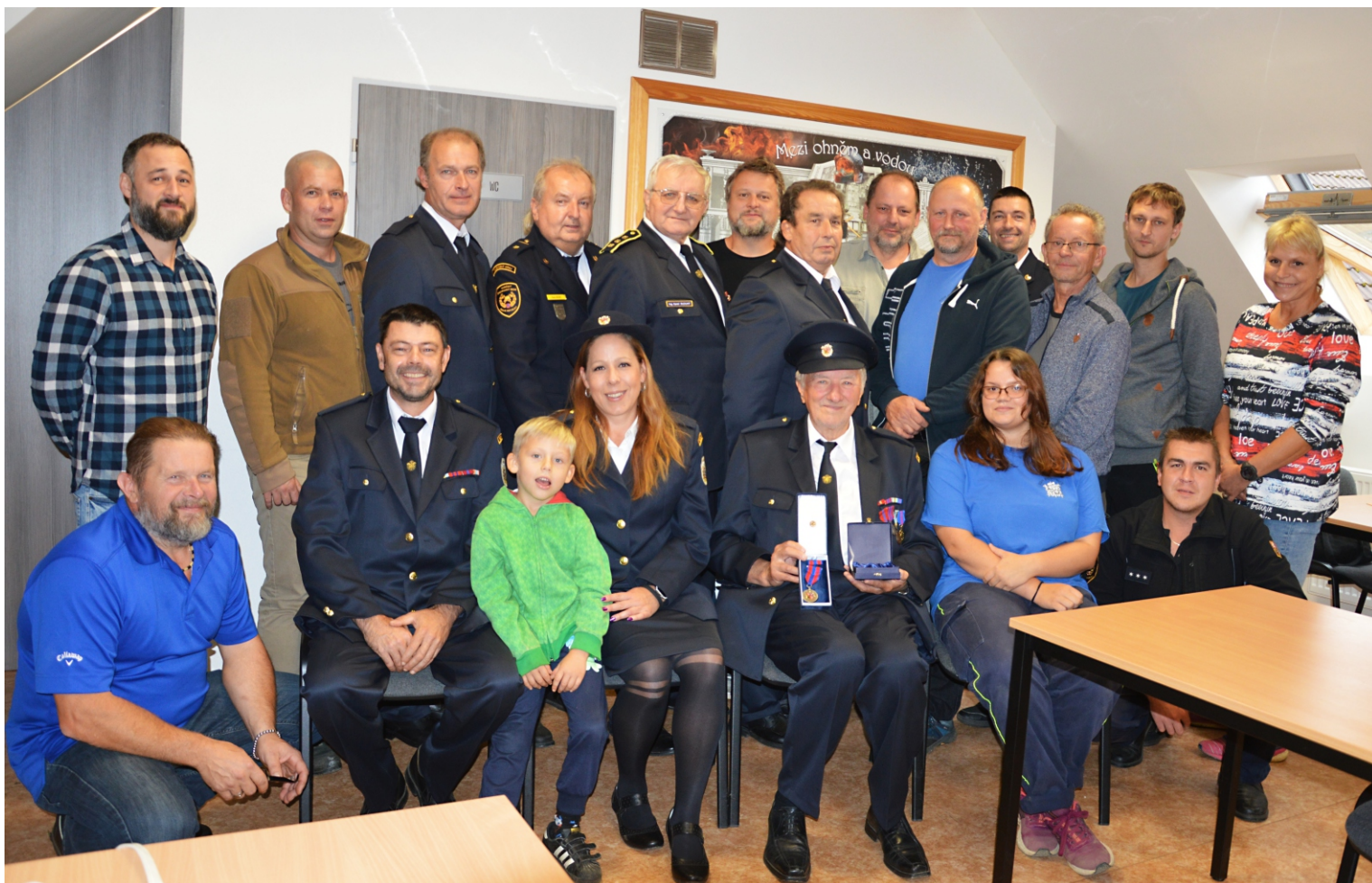
Foto: účastníci slavnostní valné hromady SDH Bušovice