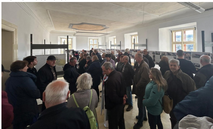
Foto: účast na výstavě věnované Bušovickým

To jsou jen některé úryvky z dojmů návštěvníků výstavy zachycené v knize hostů, za které děkujeme a vážíme si jich. Děkujeme také všem obyvatelům a obyvatelkám Bušovic i majitelům a majitelkám objektů, se kterými byly uskutečněny krátké rozhovory, a zejména těm, kteří se nechali vyfotografovat. Za tisk panelů velmi děkujeme studiu La Frette. V průběhu výstavy i po ní jsme zaznamenali požadavky na drobné korekce textů, děkujeme za ně, zahrneme je do zpracování písemné verze materiálu.