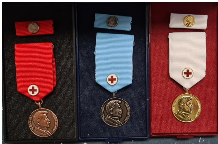
Foto: Medaile prof. MUDr. Jana Janského pro 10, 20 a 40 násobné dárce krve

Rokycanská nemocnice (v obou institucích je v provozu moderní online rezervační systém). Nejzákladnější podmínky jsou věk mezi 18 a 65 lety, hmotnost nad 50 kg a splnění řady zdravotních a hygienických podmínek. Důvodem je skutečnost, že někdo nemůže z objektivních příčin darovat krev, aniž by ohrozil zdraví své či zdraví příjemce. Splnění podmínek lze částečně zkontrolovat na stránkách transfuzních stanic, nicméně rozhodné slovo má vždy lékař, který je přítomen na stanici. Výčet podmínek může působit komplikovaně, ale vše má svůj důvod a není se čeho obávat. Pokud se rozhodnete zkusit darování krve, tak Vám bude na transfuzním oddělení vše vysvětleno - nicméně si budeme muset projít, ostatně jako každý, procesem, který zahrnuje: vyplnění dotazníku a udělení informovaného souhlasu, odběru krevního vzorku, základní vyšetření a posouzení lékařem a bude-li vše v pořádku, tak vlastní odběr krve, odpočinek a občerstvení po odběru a pracovní volno (v případě, že jste zaměstnanec můžete v den odběru využít díky tzv. obecnému zájmu pracovní volno s náhradou mzdy).