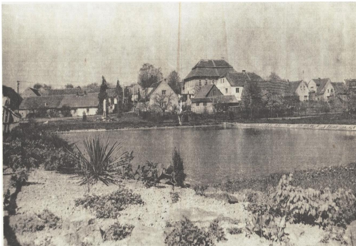
Historický pohled na rybník v Bušovicích v pozadí se zámek