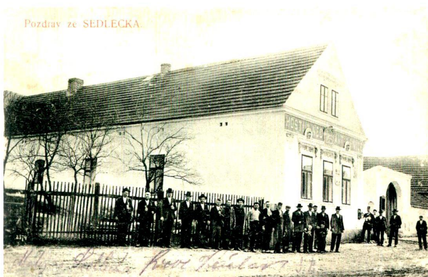
Hostinec „U Matějí“