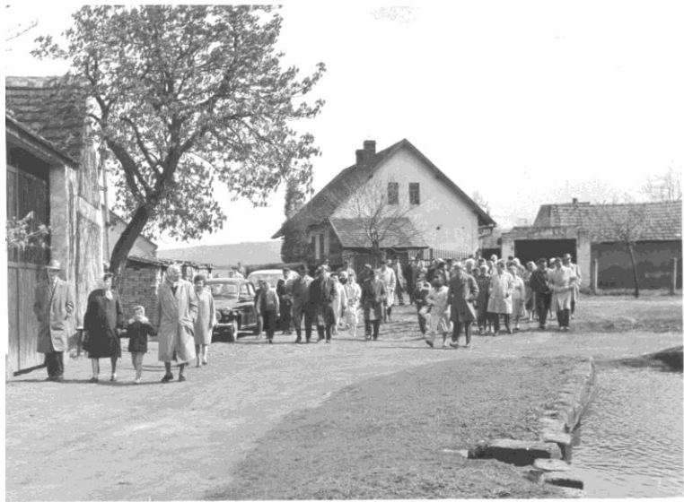
Občané Sedlecka při prvomájové procházce v roce 1964 – náves Sedlecko