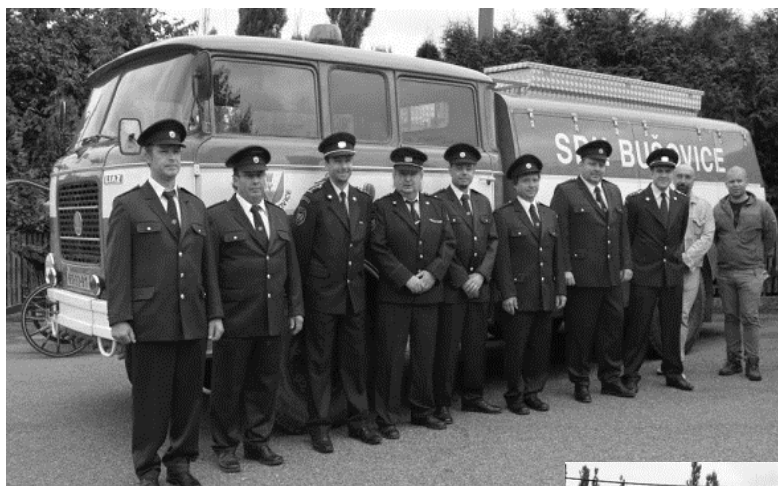
Hasiči před cisternovou stříkačkou CAS 25

Událostí roku pro naši jednotku bylo slavnostní předání bezúplatně převedeného zásahového vozidla CAS 24 Terno od Hasičského záchraného sboru Plzeňského kraje, požární stanice Plasy. To se uskutečnilo v sobotu 18. září 2021. Slavnostnímu aktu přihlíželi také hasiči z jednotky Litohlavy, kteří v rámci převodů mezi jednotlivými sbory převzali též bezúplatně převedenou od obce Bušovice cisternovou stříkačku CAS 25 Š 706.