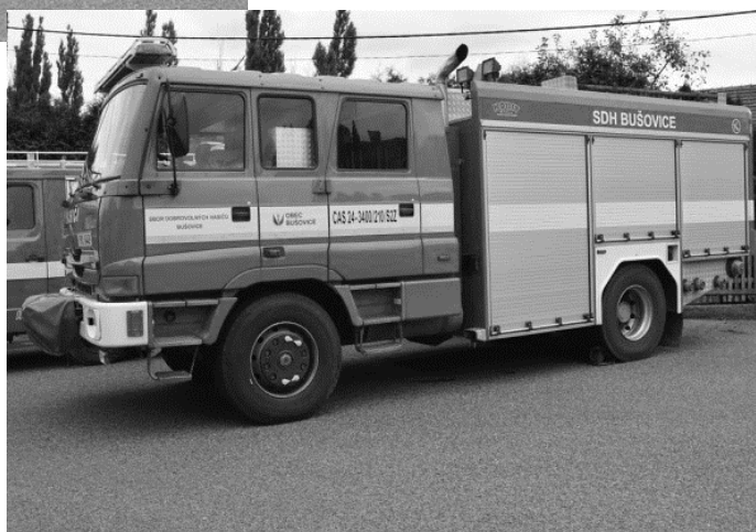
Zásahové vozidlo CAS 24 Terno