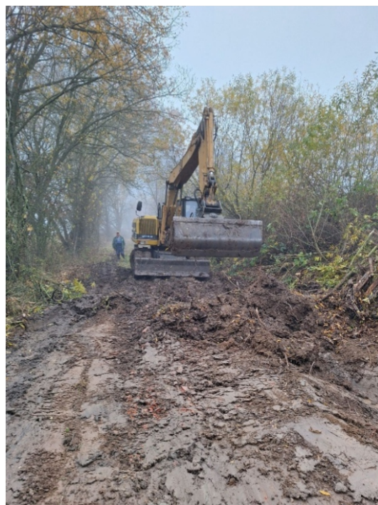
stav cesty před rekultivací a při zahájení prací