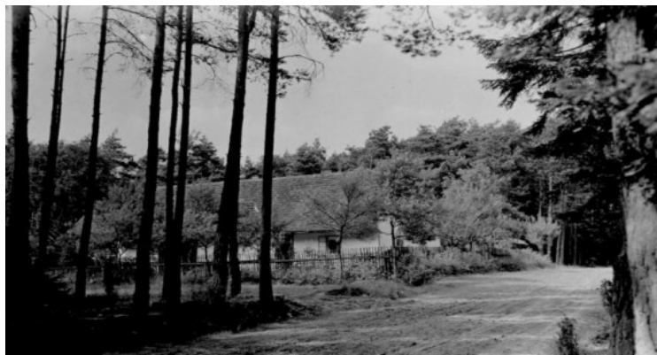
Foto: Hájovna čp. 27 z jihozápadní strany, někdy v meziválečném období. Cesta na obrázku pokračuje směr Ostrý kámen. Za hájovnou ji kříží další cesta z Horomyslic do Klabavy