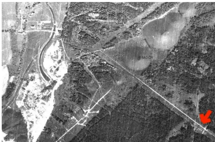
Foto: Letecký snímek z roku 1963 ukazuje činnost hrudkoven v blízkosti hájovny (červená šipka ukazuje její polohu).