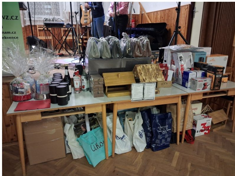
[Karel Dlouhý] Foto: tombola hasičského plesu (archiv Karel Dlouhý)

To je pro tentokrát vše. V dalším čísle Bušovického zpravodaje se dozvíte, jak jednotlivé akce proběhly a co nového hasiči vykonali či připravili.