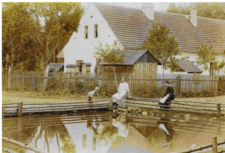
Foto: hájovna Horomyslice čp. 27, lidé na obrázku jsou z Brujovy rodiny (rok zřejmě kolem 1900) (archiv Pavla Velleková)

V pravém horním kvadrantu jsou vidět 4 velké haldy mleté strusky (archiv Pavla Velleková)